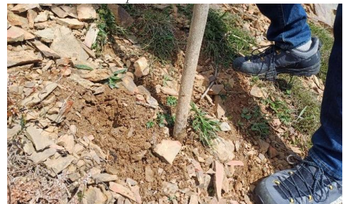
Prospection de la profondeur du sol