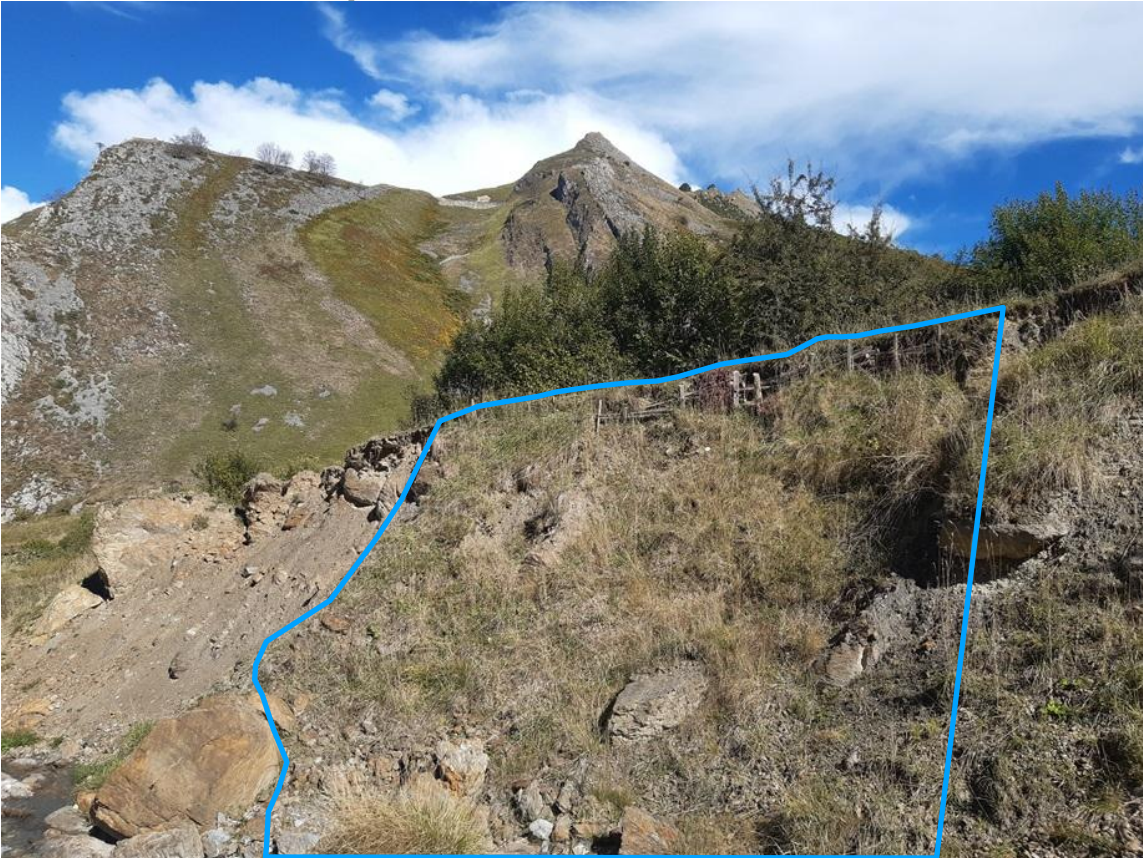
Zone traitée avec fascine et plantation d'arbres en octobre 2025. A gauche, sur la zone non traitée où les glissements de terrain se poursuivent.