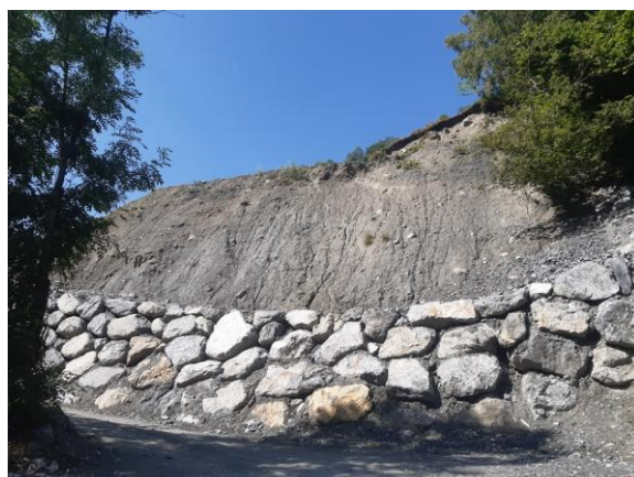
Réparation d'un glissement de terrain sur dépôt morainique à Sers, 19/07/24