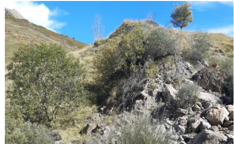
Zone d'observation des espèces naturellement présentes