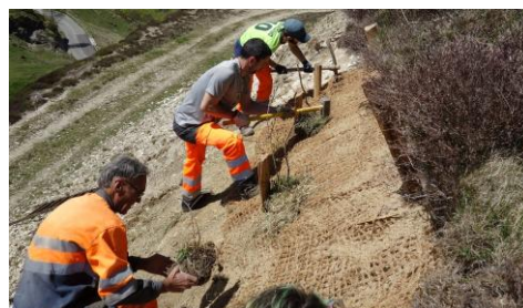
Plantation de plants en motte sur talus