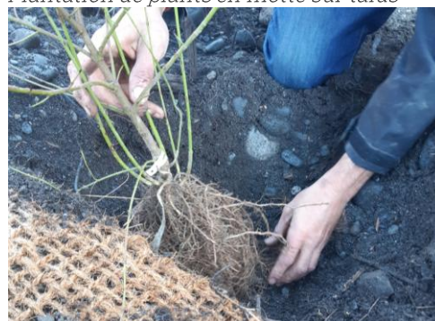
Plantation d'arbustes Végétal local en racine nue