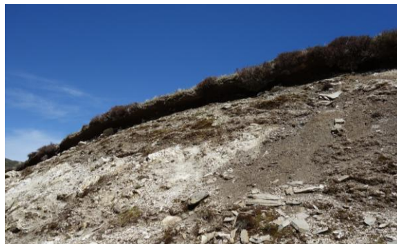
Erosion régressive sur un talus, Crêtes blanches à Béost, 19/05/21