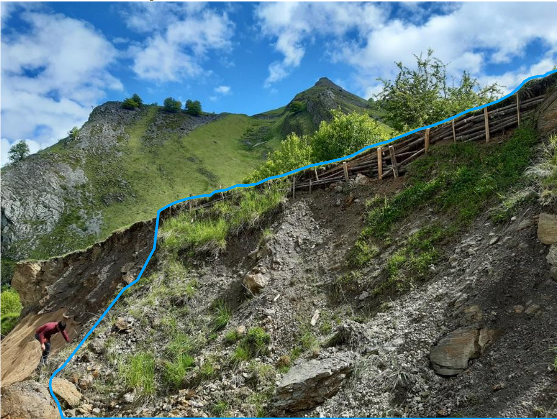
Zone traitée avec fascine et plantation d'arbres en mai 2024