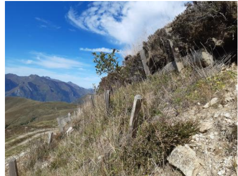
Saule marsault transplantés sur un talus restaurés, Crête blanche N+3