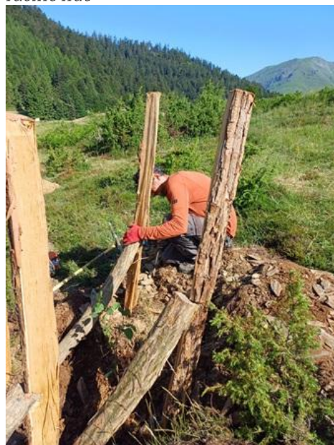
Installation d'une protection en grillage

En fin de chantier, n'oubliez pas d'actualiser le plan des plantations ou d'en dessiner un pour faciliter le suivi-évaluation par la suite.