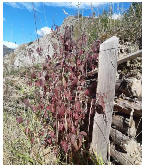
Cornouiller sanguin contre une structure anti-érosive, Arbéost N+2.