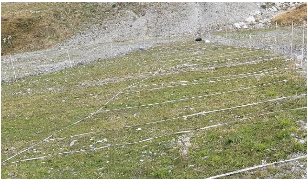
Figure 11 : Suivi des expérimentations le 21/09/23