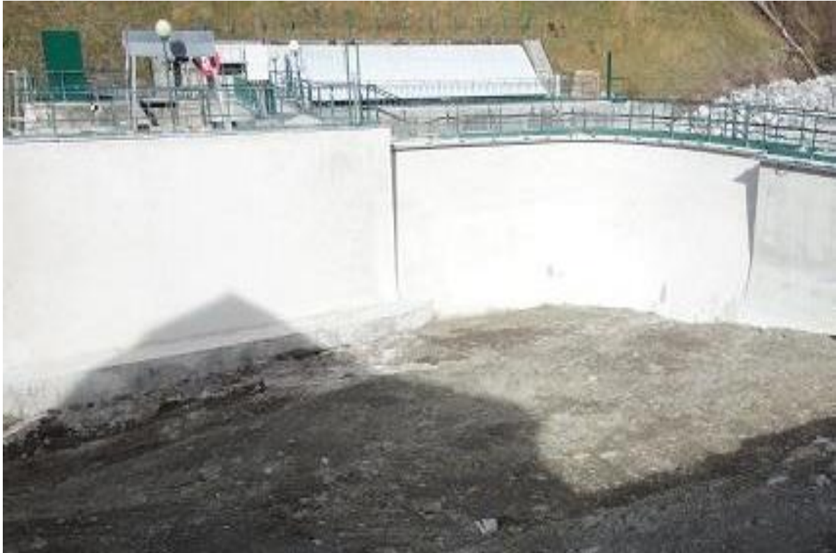
Figure 15 : Site avant semis d'un mélange de prairie de fauche locale à l'hydroseeder, le 18/10/2020