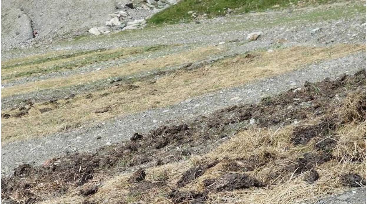
Figure 10 : Installation des expérimentations le 27/05/20