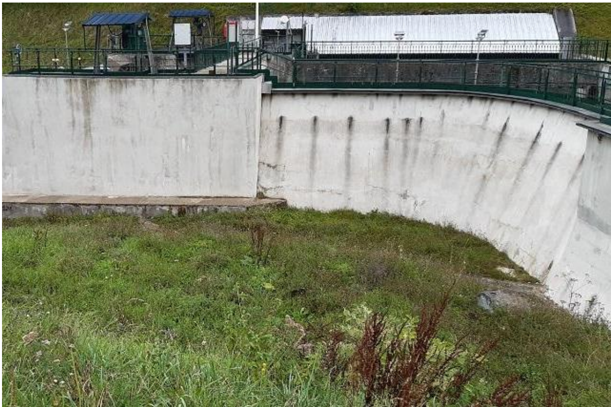
Figure 16 : Prairie obtenue trois ans plus tard, le 21/09/2023