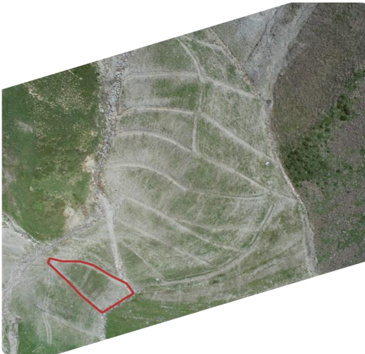
Figure 14 : Piste de ski en cours 21 mois après restauration (28/05/24, B. Mazery)