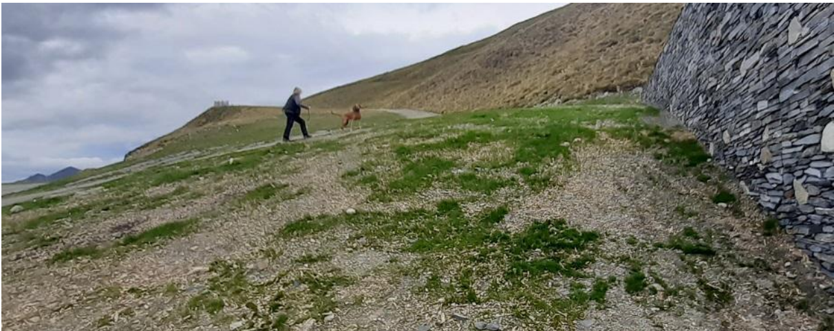
Figure 6 : Talus après semis et amendement le (21/09/23)