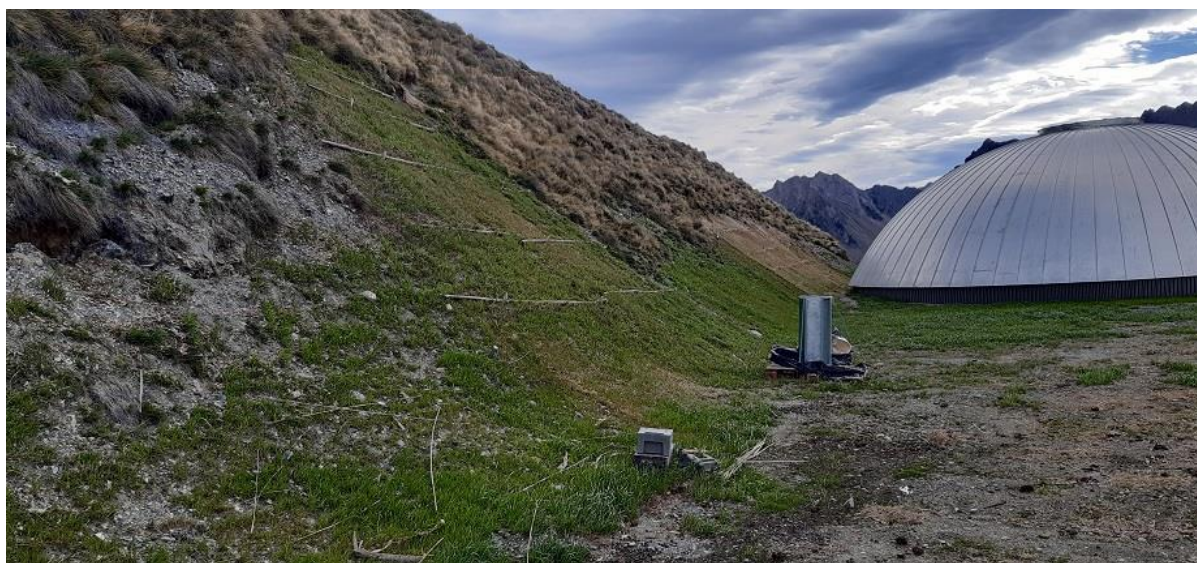
Figure 4 : Etat de la re-végétalisation fin septembre 2023 (21.09.23)