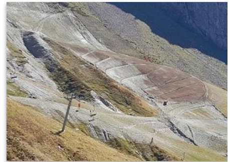
Figure 12 : Piste de ski pendant l'épandage de fumier (21/09/22, P. Doux)