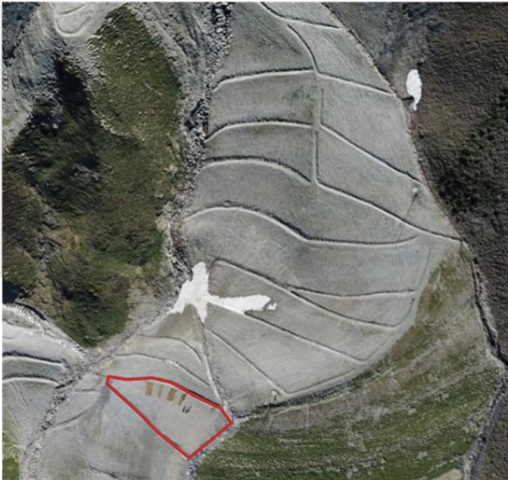
Figure 13 : Piste de ski avant restauration (26/05/20)