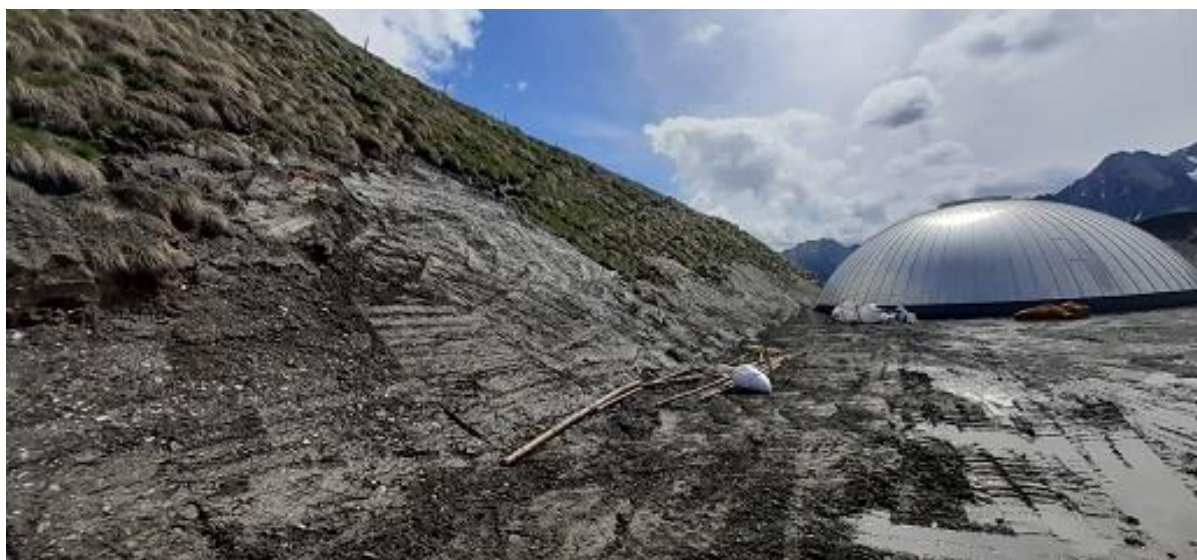
Figure 3 : Talus au moment du semis (08/06/23)