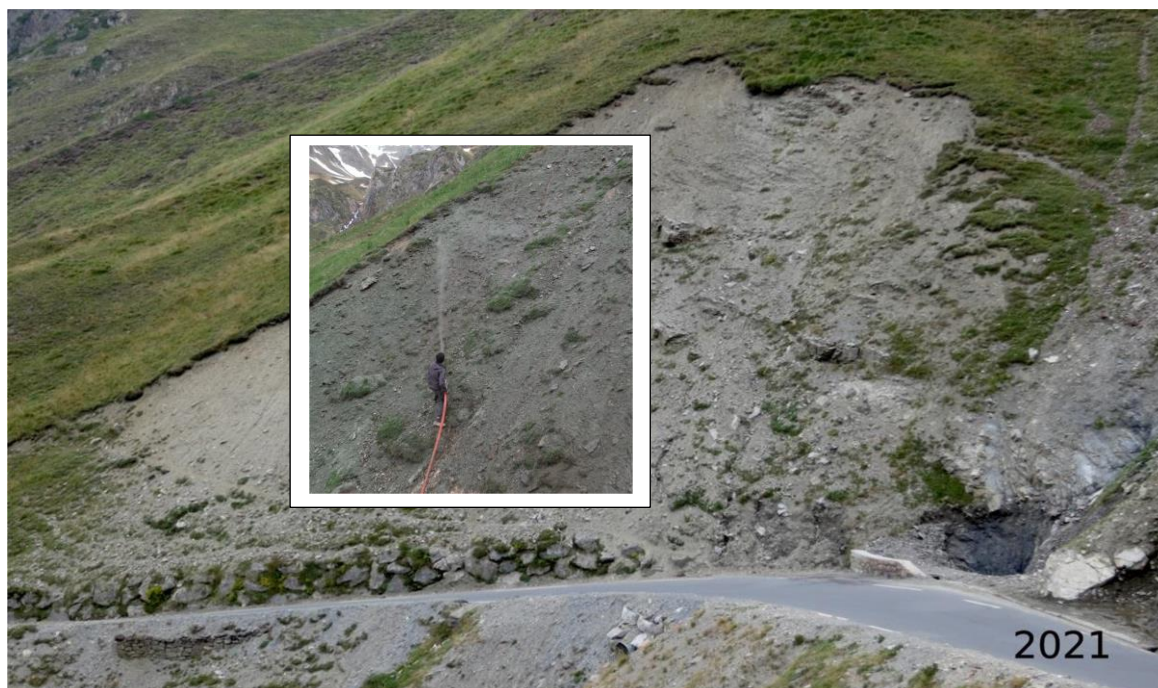
Figure 8 : Talus avant restauration écologique (fond d'écran, le 05/09/21) et pendant le semis à l'hydroseeder (20/05/21)