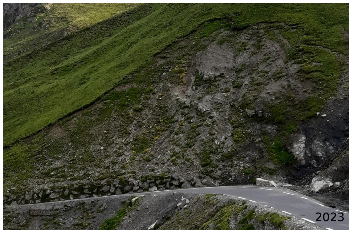
Figure 9 : Talus 2 ans après les semis et apports d'amendement organique (11/09/23)