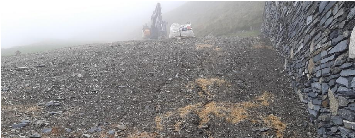
Figure 5 : Talus au moment du semis et de l'épandage de broyats de bois (03/08/23)