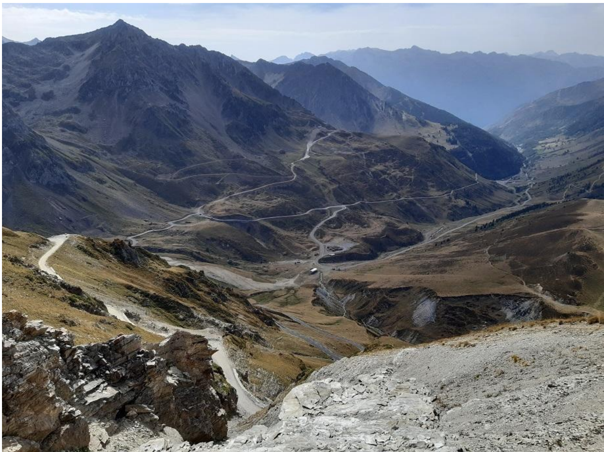
Partie amont de la vallée du Bastan après un été sec (12/09/22)